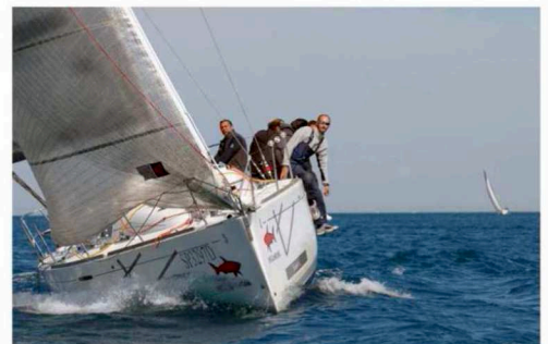
TROFEO ACCADEMIA NAVALE 2008-BARALDI

L'abilitazione G.M.D.S.S. è obbligatoria per apparati VHF+ DSC, anche per il DIPORTO, in sinergia con l'istituto tecnico nautico di LA SPEZIA