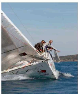
TROFEO ACCADEMIA NAVALE 2008-BARALDI-Foto Fabio Taccardi

AGENZIE PRATICHE NAUTICHE Rinnovi patenti nautiche cert. Di sicurezza ecc.